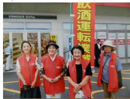
飲酒運転撲滅運動

昨年12月には、少年院「筑紫少女苑」を見学しました。在院者は、生活指導、職業指導、教科指導などの矯正教育を受け、更生に向けて頑張っていました。