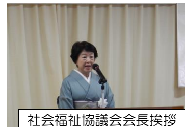
社会福祉協議会会長挨拶