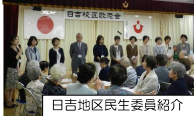
日吉地区民生委員紹介