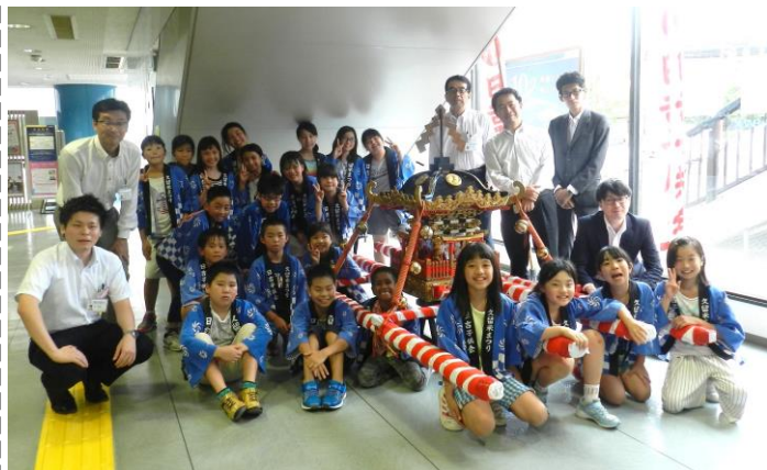
～福岡銀行東久留米支店行員の皆さんと～

日吉校区子ども会は、毎年「水の祭典」昼の部パワーストリートに参加しています。伝統の重い神輿を担ぎ、勢いよく明治通りを駆け抜けます。皆様の応援のお声掛けをよろしくお願い致します！